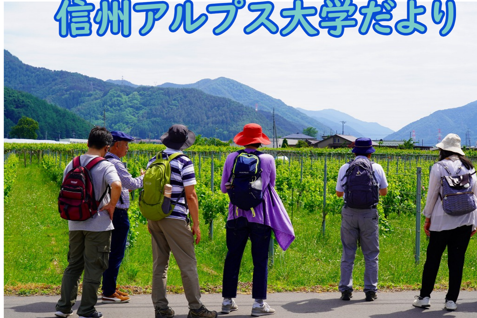
6月12日 塩尻景観ワイン散歩